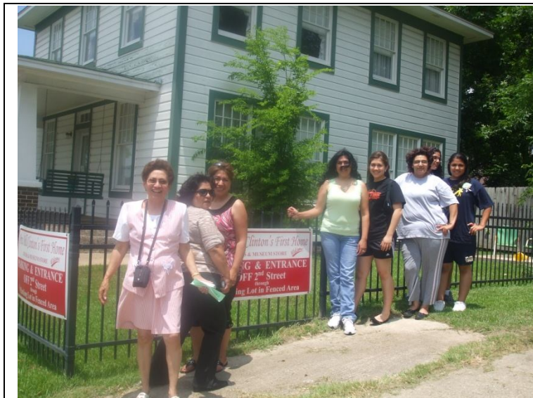
Western Heights Ladies after a ladies conference visit the childhood home of President Clinton / Damas de las Alturas del Oeste después de una conferencia de damas visitan el hogar de niñez del Presidente Clinton – Hope, Arkansas 6/7/08